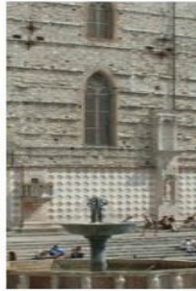
PERUGIA - ASSISI